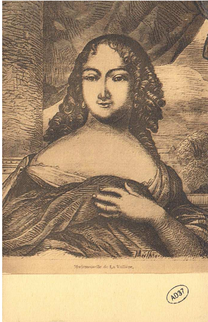
Archives départementales d'Indre-et-Loire, 10 Fi 62 /8 : Mademoiselle de La Vallière.