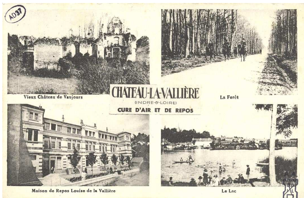
Archives départementales d'Indre-et-Loire, 10 Fi 62 /31