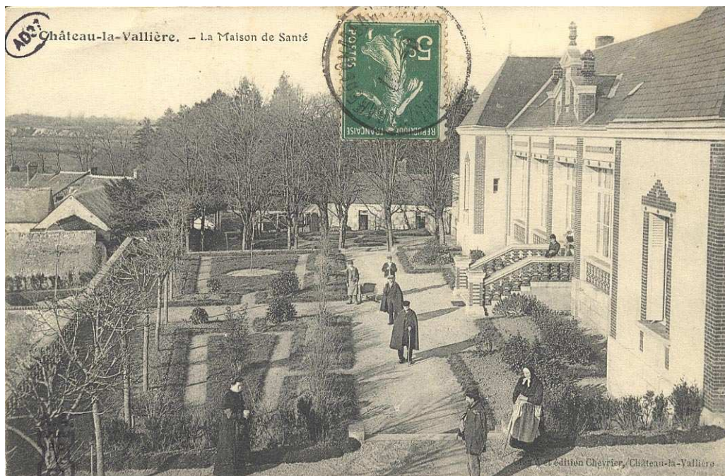
Archives départementales d'Indre-et-Loire, 10 Fi 62 /63