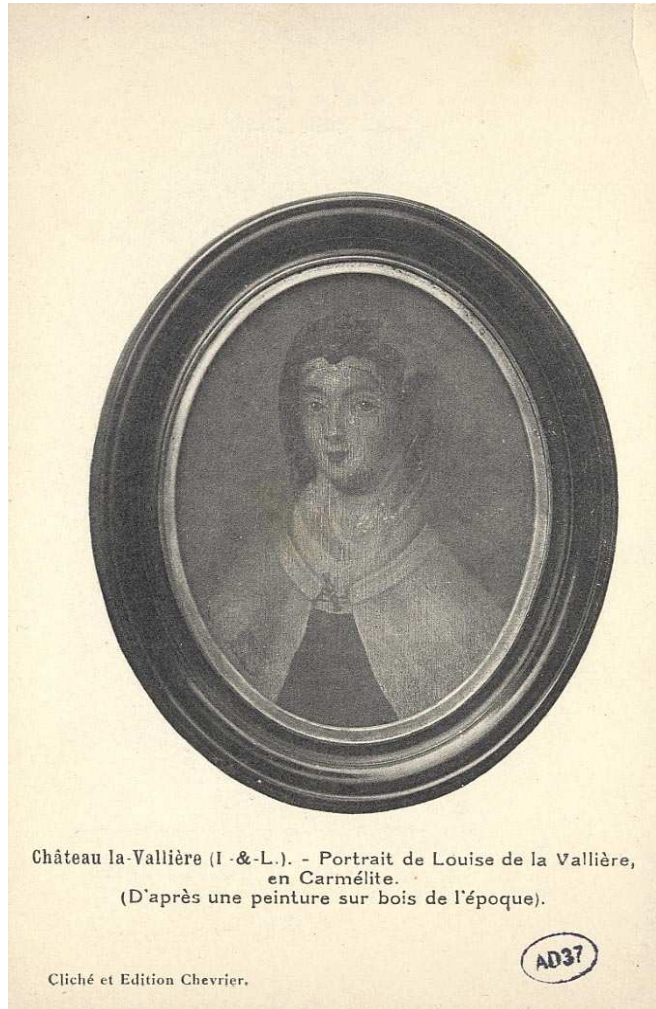
Château la-Vallière (I.-&-L.). - Portrait de Louise de la Vallière, en Carmélite. (D'après une peinture sur bois de l'époque).