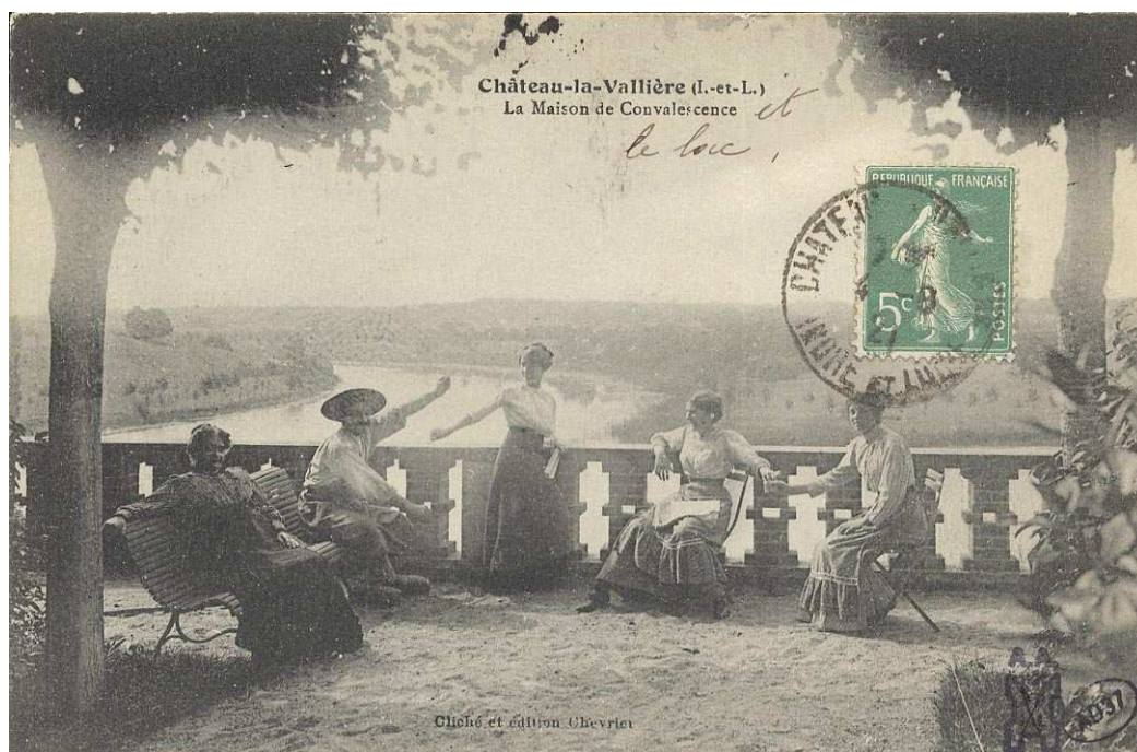
Archives départementales d'Indre-et-Loire, 10 Fi 62 /61