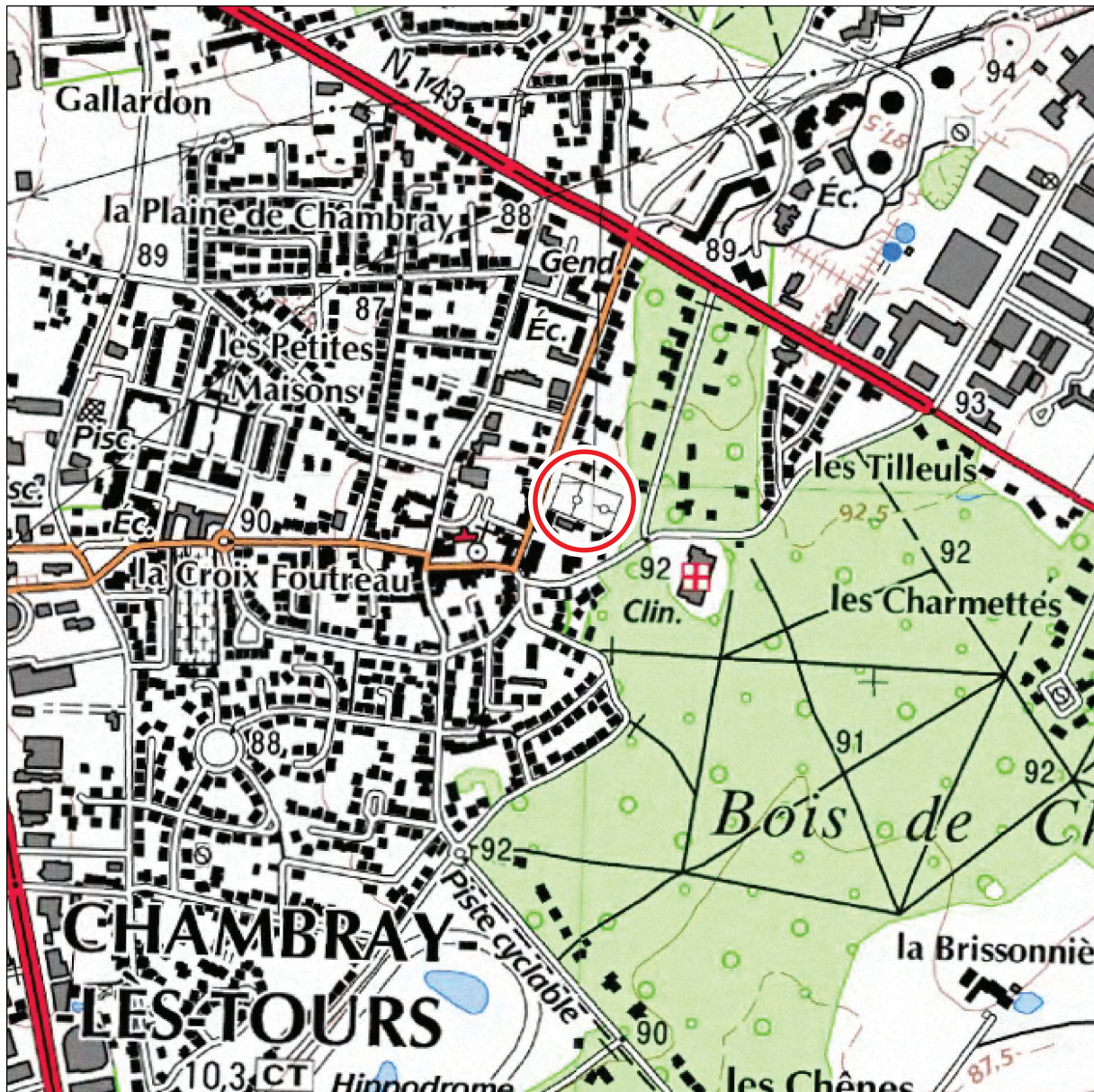
Figure 2 : Localisation du diagnostic sur la carte IGN au 1 / 25 000 e (© IGN Paris - Scan 25, 2005 - Autorisation de reproduction n° 2006/CUDC/0186)