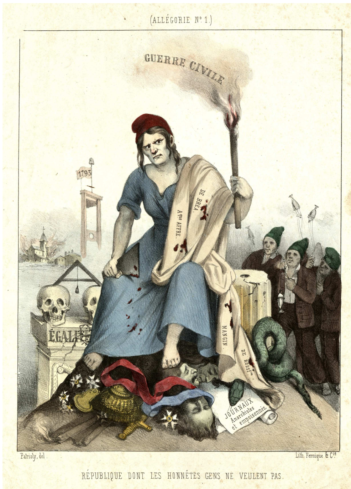
Allégorie n° 1. République dont les honnêtes gens ne veulent pas, [1848] (A.D.I.L., gravure, 230 J 105)