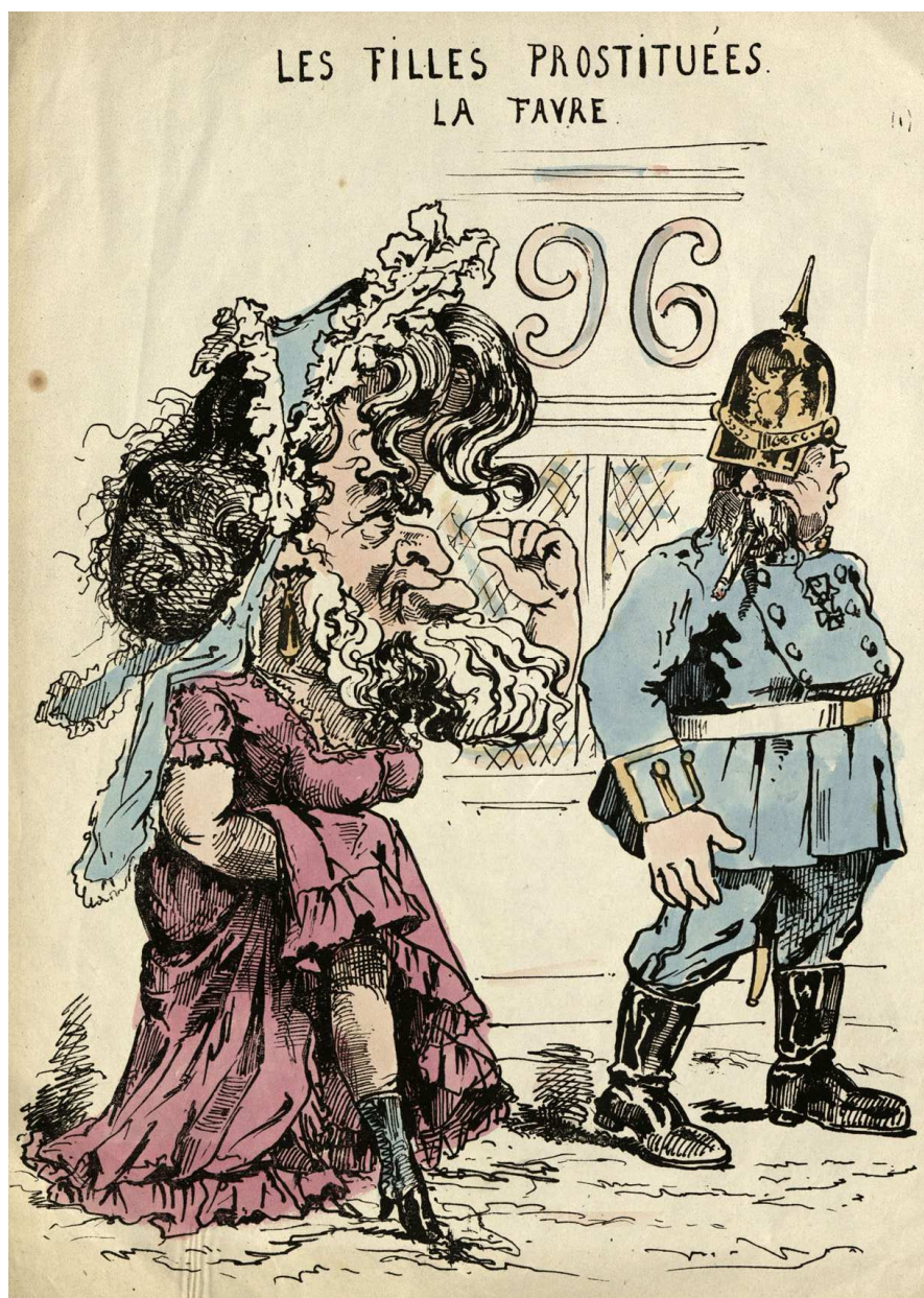
Les filles prostituées. La Favre (A.D.I.L., gravure, 230 J 892)