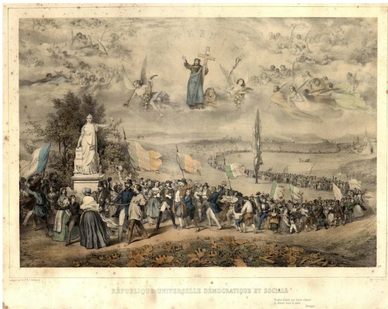
République universelle démocratique et sociale [1848] (A.D.I.L., gravure, 230 J 54)