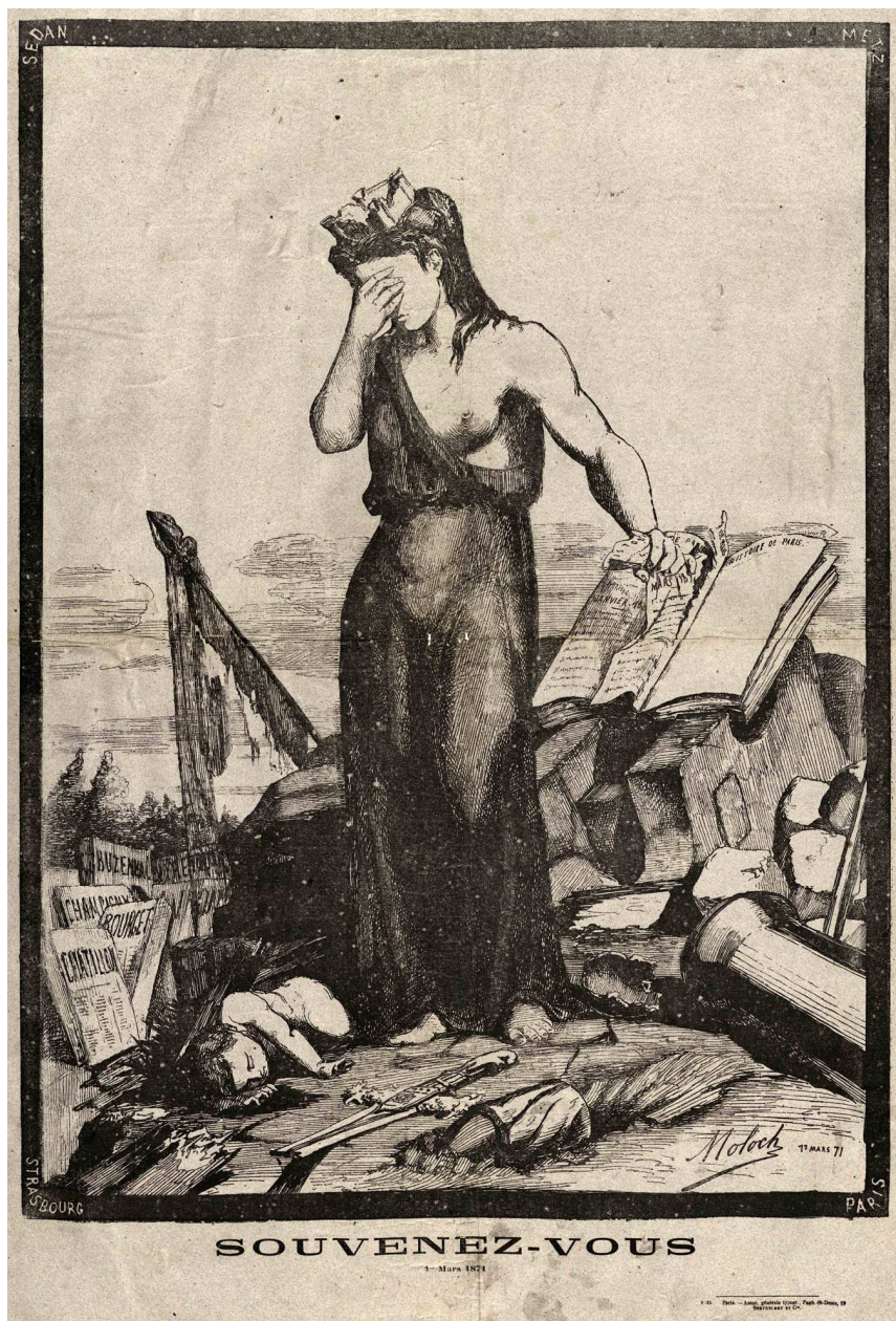
Souvenez-vous 1 er mars 1871 (A.D.I.L., gravure, 230 J 1012)