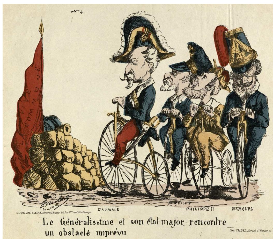
Le Généralissime et son état-major rencontre un obstacle imprévu (A.D.I.L., gravure de Bertal, 230 J 906)