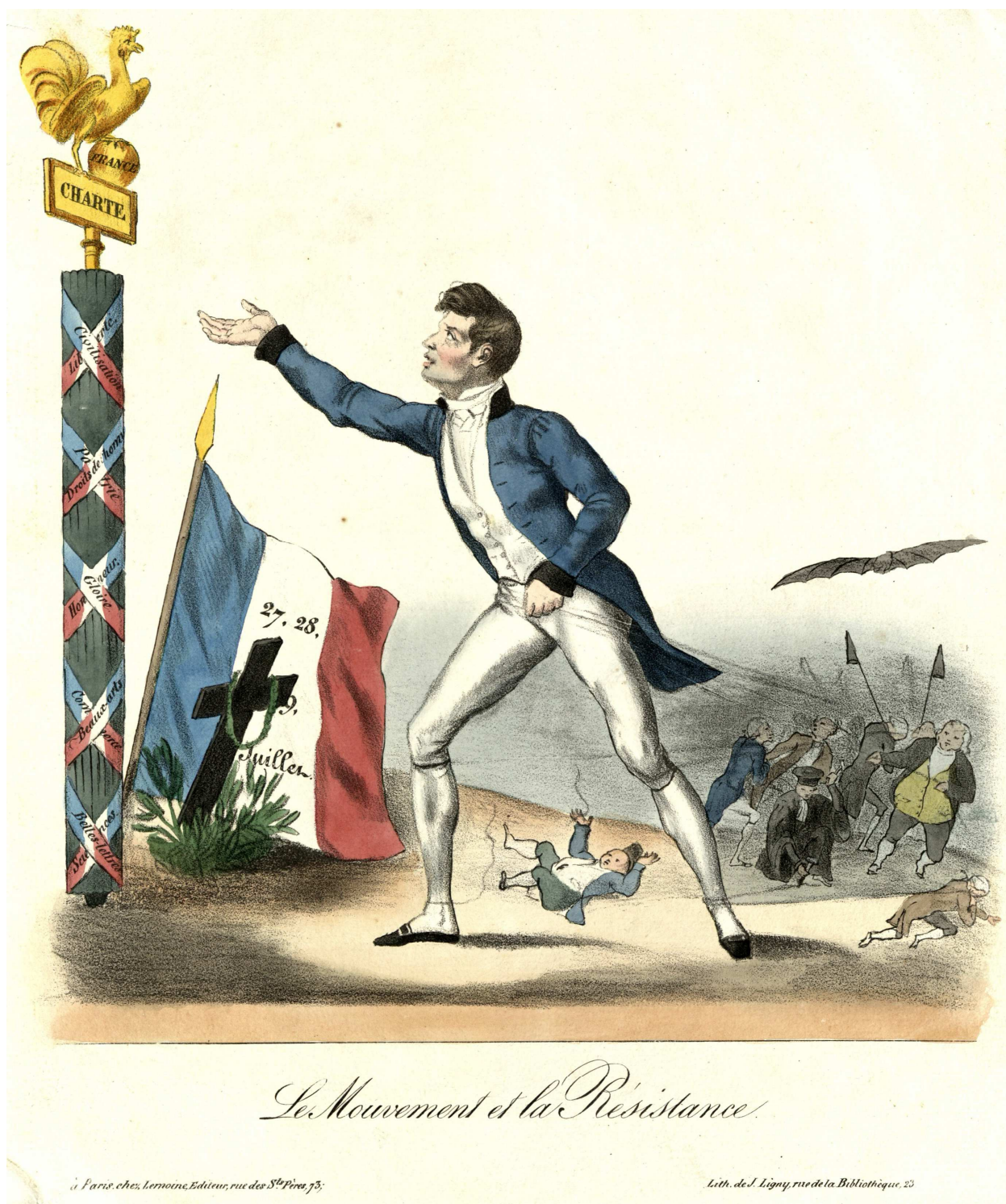
Le mouvement et la Résistance [1830] (A.D.I.L., gravure, 230 J 36)