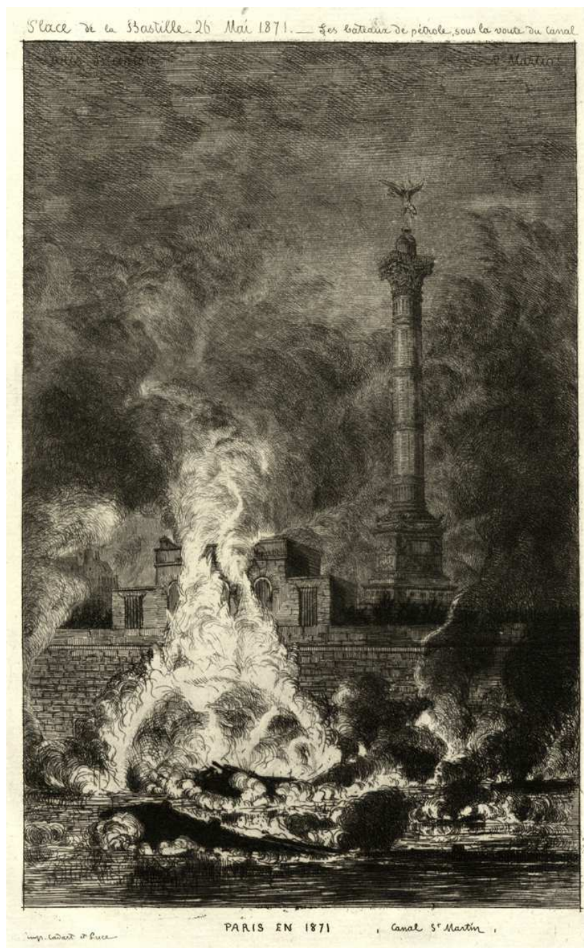
Paris incendié, eau-forte de Martial (A.D.I.L., 230 J 960)