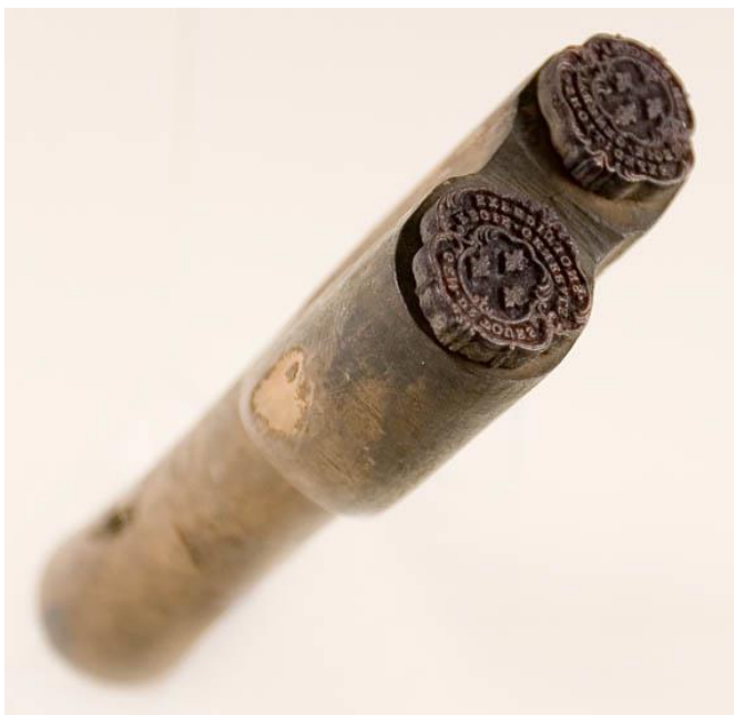
Généralité de Tours Marteau portant l’empreinte du cachet des droits réunis, XVIII e siècle