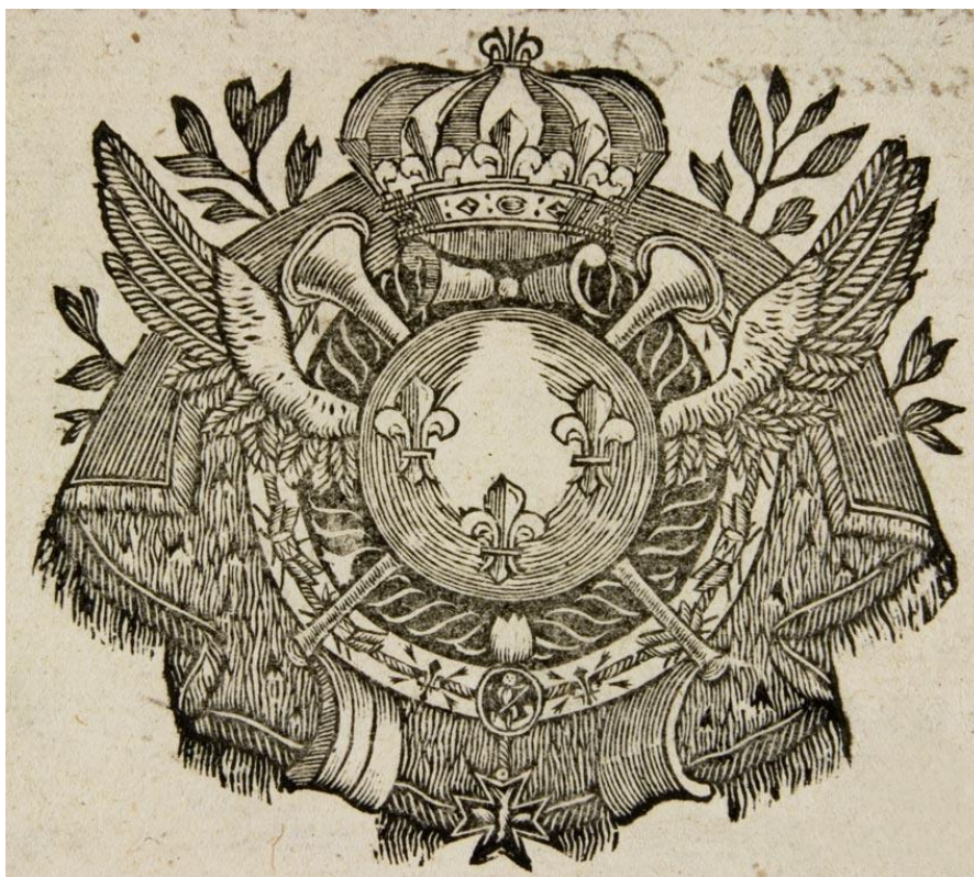
Bureau de Bourgueil Registre des insinuations suivant le tarif, 1705-1711 : détail (A.D.I.L., 2 C 676)