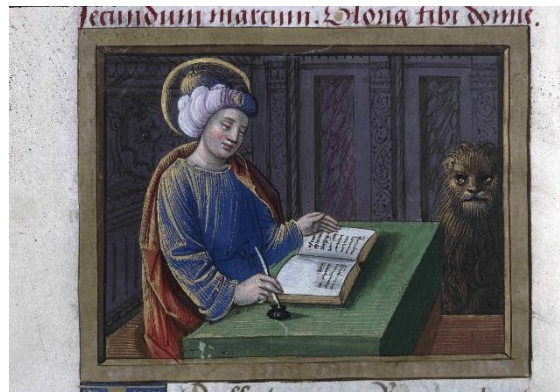
BM Tours, ms. 2283

La mallette peut être utilisée en 4 séquences :