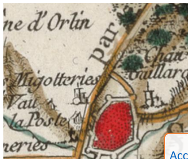
La Carte de Cassini