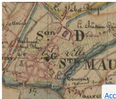
Le cadastre napoléonien