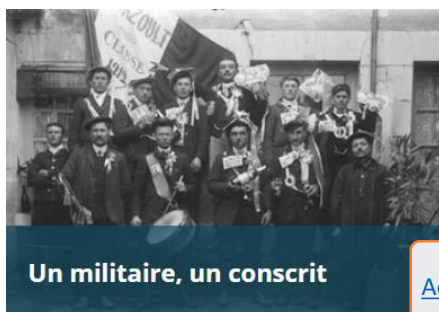
Un militaire, un conscrit