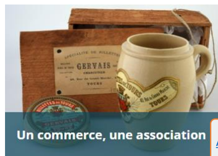
Un commerce, une association