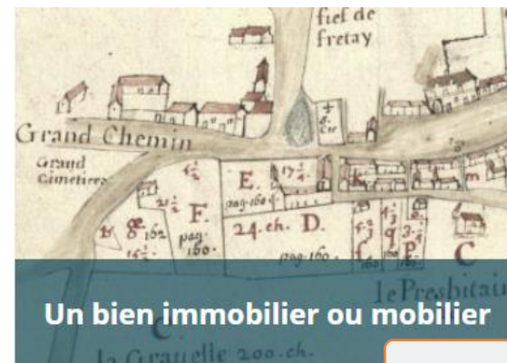
Un bien immobilier ou mobilier