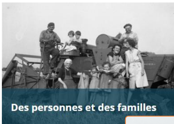
Des personnes et des familles