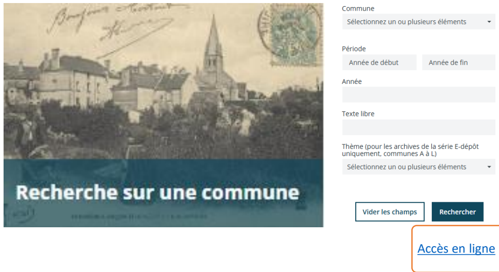
Tableau complet des communes d'Indre-et-Loire

Depuis le Premier Empire avec la répartition des communes par canton et par arrondissement au fil du temps.