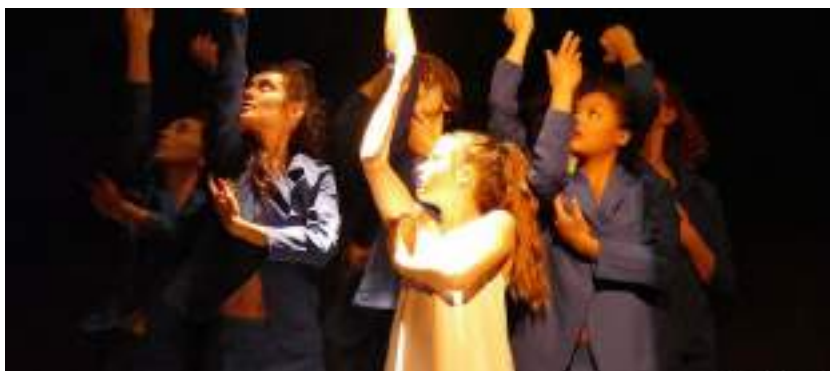
La Cieff - A propose de Barbe Bleue