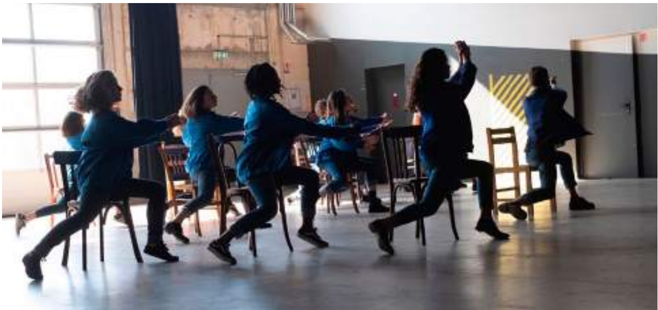
projet Rosas Remix-CCNT - lycée Paul-Louis Courier