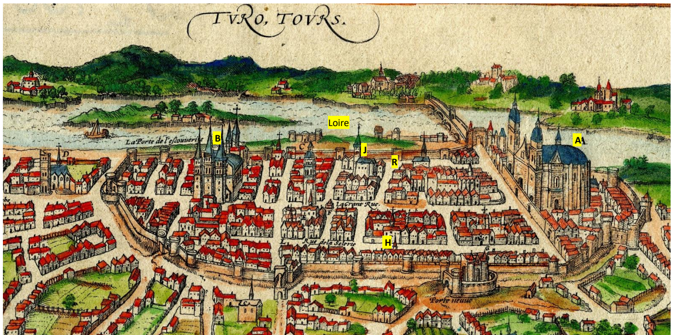
Plan de Tours, 1596 (d'après un plan de 1553)